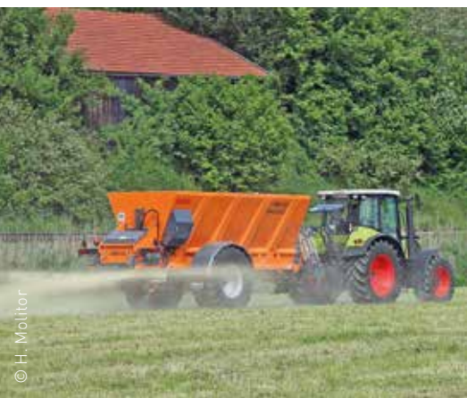
Der Kalk wird ausgestreut. Er gelangt später mit dem Regen in den Boden.

Das Kalken verbessert über die Nährstoffversorgung der Pflanzen auch die Versorgung der Tiere, die die Pflanzen fressen. Zum anderen steigt der Anteil der Pflanzenarten, die den Tieren